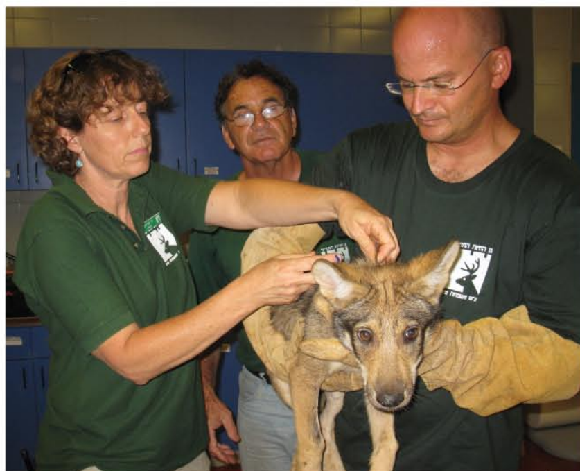
טיפול ראשון במרפאת גן החיות.

הקשר בין בני האדם לזאבים הוא קשר קדמוני מאוד - הזאבים התקרבו אל בני האדם גם בשל סקרנותם וגם מכיוון שהם הבינו שבקרבת האדם יש מזון שיכול לסייע להם. בני האדם אספו כנראה גורי זאבים, וגידלו אותם, וכך בייתו אותם בהדרגה. מכיוון שגם הזאבים חיים בלהקות המונהגות ע"י מנהיג ברור, היה תהליך הביות קל יחסית, והזאבים הפכו להיות חלק ממשפחות בני האדם. הרבה דעות קדומות אופפות את הזאבים. יללות הזאבים שהפחידו את האדם בלילות, והיותם טורפים גדולים ומאיימים הפכו אותם לדמויות הרעות והכוחניות באגדות ובמיתוסים שונים. בארץ, הבעיות בשימור הזאבים מהוות דוגמה להתלבטויות הקיימות תדיר בנושאי שמירת טבע. קשה מאוד לשמור על איזון בין חיות הבר לבין צרכי הגדלים ומשתנים של האדם. ברמת הגולן, חל חיכוך מתמיד בין צרכיהם של מגדלי הבקר, שעדריהם משוטטים בשטחים נרחבים ברחבי הרמה, לבין צרכיהם של הזאבים, התרים אחרי צייד זמין ועבורם העגלים הם טרף קל. גם בעולם הביא הרס בתי הגידול, יחד עם הציד והפגיעה בטרפם של הזאבים, לצמצום אזורי המחיה שלהם באופן משמעותי. זו היא הזדמנות נפלאה לראות את הזאבים, לשמוע וללמוד כיצד באמת ניתן לחיות עם הזאבים. בואו לראותם בתצוגה החדשה.