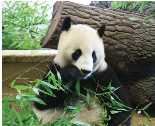
מפגש עם הפנדה בגן החיות של וינה - חוויה שלא תשכח.

מאז גילויה של הפנדה הענקית לעולם המערבי בשנת 1869, ביקשו גני חיות רבים לקבל לידיהם פנדות. גני חיות השקיעו כספים רבים בקנייה של פנדות מסוחרים, ואנשים נהרו לראות את בעל החיים הישנוני והיפה הזה. בתחילת שנות השבעים אף נטבע המושג "דיפלומטיית פנדות" כאשר הנשיא האמריקאי ניקסון ביקר בסין (היה זה ביקור ראשון של נשיא אמריקאי בסין) וקיבל במתנה זוג פנדות ענקיות אשר שוכנו בגן החיות הלאומי. באחרונה נשמעה ביקורת על ההשקעה העצומה בבעל חיים יחיד, שאומנם נמצא בסכנת הכחדה חמורה, אך מסיט תשומת לב ממינים רבים אחרים. ההשקעה של מיליוני דולרים על מנת להביא את הפנדה לגן החיות, יכולה לשמש להצלת מינים אחרים בטבע. מרכזי הריבוי שאמורים להרבות ולהגן על הפנדות, טוענים אותם מבקרים, משמשים כאתרי תיירות ואין בהם צורך של ממש. למרות שהרבייה המלאכותית מוצלחת מאוד, אין לפנדות באמת לאן לחזור. גם הפנדות המעטות ששוחררו לטבע הצליחו לשרוד רק מספר חודשים, עד שמתו מרעב או במאבקים עם פנדות מהטבע.