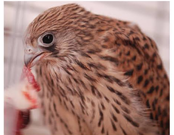
פירחון בז אדום, בדרך לחופש.

המרכז הארצי להדגרת דורסים המצוי בגן. הביצים הודגרו כ-3 שבועות (זמן הדגירה המקסימלי הוא 28 יום), כשהצוות עוקב אחריהם ברצף. לאט, לאט החלו הבקיעות. הבזים הקטנים ממחרים לבקע את קליפות הביצה ובמהרה שומעים את ציציהם. זה אומר, שמהר, מהר צריך גם להכין להם את הארוחה הראשונה. ממש כמו ההורים - הבזים, גם המטפלים שלנו מכינים להם נתחי בשר קטנטנים אותם הם לומדים לבלוע ברעבתנות גדולה. לאט לאט מגדילים את מנות הבשר, עד שהגוזלים, (הנקראים כבר פירחונים - המוכנים לפרוח מהקן), מצליחים לאכול בעצמם עכבר או חרק שלם. מטפלי מחלקת ציפורים משמשים ממש כהורים של