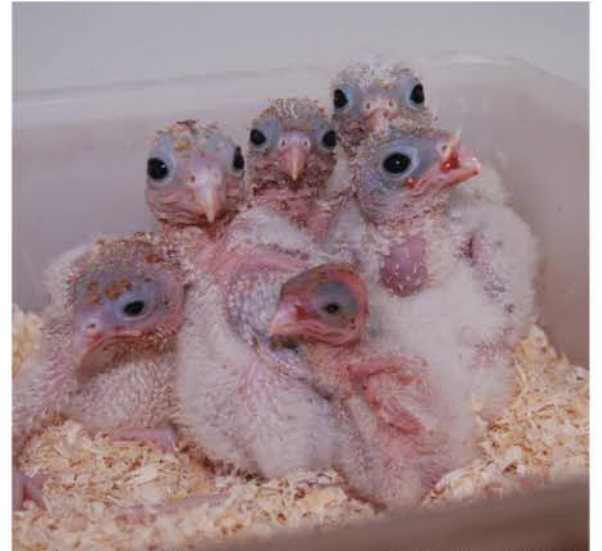
גוזלי בז אדום צעירים.

הפתעה! כשטיפסו המטפלים אל תיבות הקינון הגבוהות הממוקמות בתצוגה הם גילו ש-7 תיבות קינון נתפסו ע"י הבזים, ומתוכם הם אספו יבול מדהים של 45 ביצים! בשל ההצלחה המוגבלת של הטיפול ההורי של הבזים, הצוות החליט להעביר את כל הביצים האדומות והמנוקדות אל