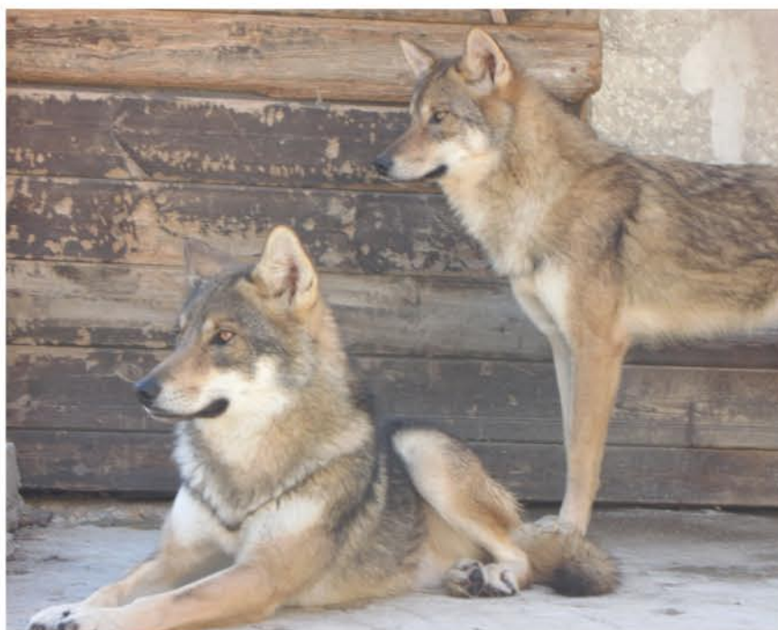
הזאבים בתצוגה הזמנית.

התצוגה היפה משתרעת על שטח של דונם וחצי, ובה יש לזאבים מרחב גדול לשחק ולרוץ, בריכה ומקומות מסתור. המבקרים יצפו בזאבים ממנהרה ארוכה, המעוצבת כמנהרת מסתור, בה ממוקמים חלונות תצפית ואפילו מחילות זחילה לילדים. במנהרה ימצא גם שילוט על הזאבים וסרטון שצולם ע"י משה אלפרט, צלם הטבע שצילם את "ארץ